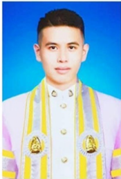
คณะพุทธศาสตร์