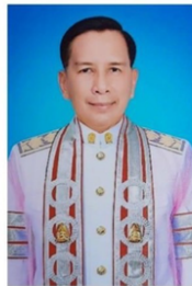
คณะครุศาสตร์