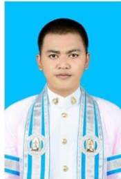
คณะสังคมศาสตร์