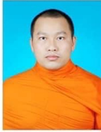
คณะสังคมศาสตร์