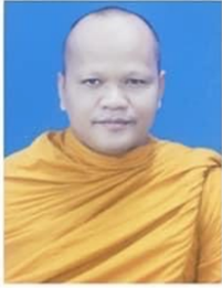
คณะพุทธศาสตร์