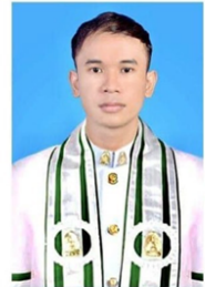
คณะมนุษยศาสตร์

สำนักทะเบียนและวัดผล มหาวิทยาลัยมหาจุฬาลงกรณราชวิทยาลัย