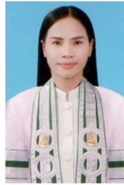
คณะมนุษยศาสตร์

สำนักทะเบียนและวัดผล มหาวิทยาลัยมหาจุฬาลงกรณราชวิทยาลัย