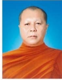
คณะครุศาสตร์