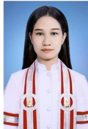
คณะครุศาสตร์