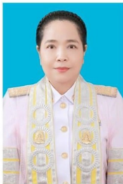
คณะพุทธศาสตร์