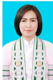
คณะมนุษยศาสตร์

สำนักทะเบียนและวัดผล มหาวิทยาลัยมหาจุฬาลงกรณราชวิทยาลัย