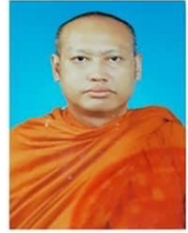
คณะมนุษยศาสตร์

สำนักทะเบียนและวัดผล มหาวิทยาลัยมหาจุฬาลงกรณราชวิทยาลัย