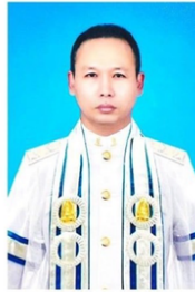
คณะสังคมศาสตร์