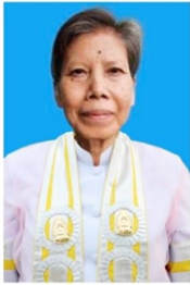
คณะพุทธศาสตร์