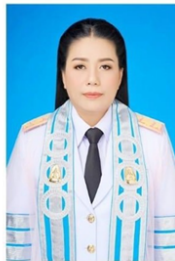
คณะสังคมศาสตร์